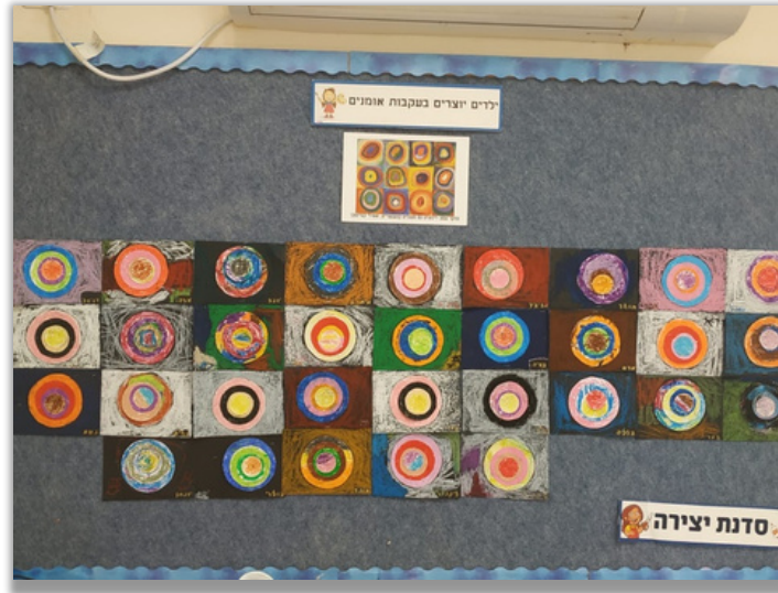
אמנות – פעילות ויצירה בעקבות קנדינסקי