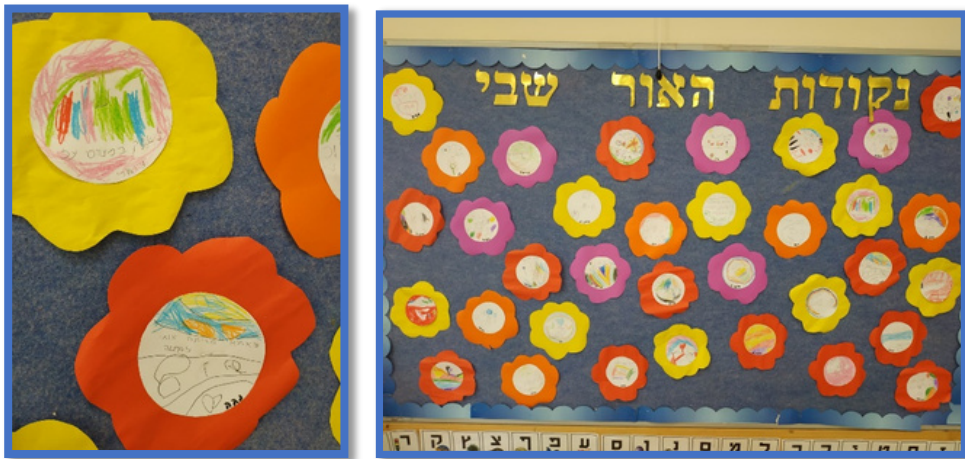
נקודות האור שבי